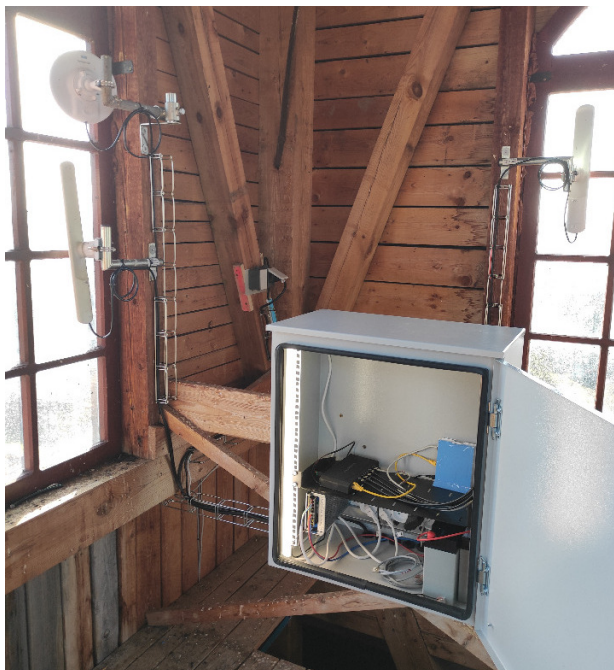
Technologie vysílače na zámku v Doloplazích.

Po delší odmlce a zároveň pár desítek hodin před velmi důležitým dnem přinášíme členům spolku Vrchonet, z.s. náš občasník Co se děje v síti . Za více jak rok od vydání zatím posledního občasníku se toho událo docela dost. Rádi Vás na následujících řádcích seznámíme s tím, co již proběhlo, na čem všem ve spolku pracujeme a co připravujeme v nejbližší budoucnosti. A podobně jako v životě nejsou vždy všechny dny „zality sluncem,“ i v našem spolku máme v posledních letech menší či větší trápení. O tom všem jsou následující řádky. Přejeme Vám příjemné počtení.