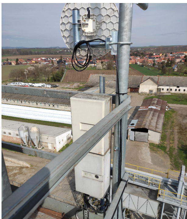
Technologie vysílače na síle v Nezamyslicích.

Započali jsme předělávku vysílače v Dřevnovicích ve mlýně. Z původně jednoduché akce výměny přívodního spoje se staly stavební úpravy – nové okno do střechy, nový stožár, rozvaděč, trasy, kabeláž a kompletní technologie. V předjaří jsme namontovali nový spoj z Vřesovic do Kelčic. Aktuálně je v Kelčicích kapacita 230 Mb/s. Výměna byla docela dost náročná, pršelo, sněžilo a střecha byla hodně prudká a porostlá mechem. Dokončili jsme předělávku na vysílači v Nezamyslicích na síle. Demontovali jsme starou kabeláž a nepotřebné antény, upravili jsme kabeláž v racku a celkově uspořádali technologii v rozvaděči. Na vysílači v Víceměřicích jsme přidali dva nové 60 GHz sektory.